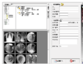
DICOMDIR読み込みシステム

構成図 保存、取り込みソフトウェアをあわせて使用することで、保存メディアの管理を行うことができます。