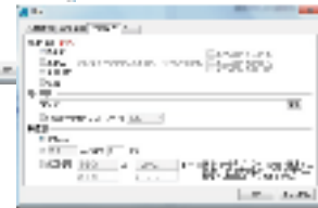
検索条件設定画面