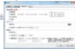
検索条件設定画面