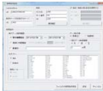
転送条件設定画面